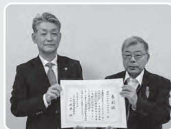
刈羽ライオンズクラブ様

11月6日開催の第75回新潟県民福祉大会において、新潟県共同募金会会長表彰の優良地区・団体表彰（共同募金運動のために5年以上協力し、功績顕著な地区又は団体）にて、刈羽ライオンズクラブ様・