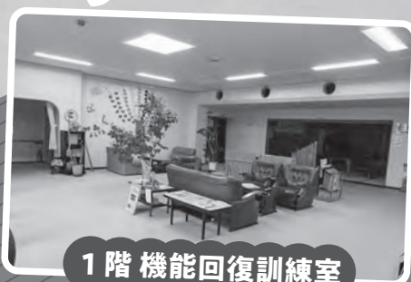
1階 機能回復訓練室